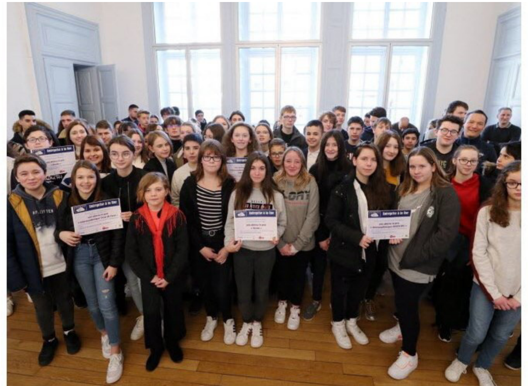
De nombreux candidats ont été récompensés grâce aux différents angles d'écriture proposés.

Mais bien d'autres candidats ont été récompensés grâce aux différents angles d'écriture proposés : l'activité de l'entreprise, le chef d'entreprise, l'innovation, la démarche sociétale dans l'entreprise, sans oublier l'illustration par la photo.