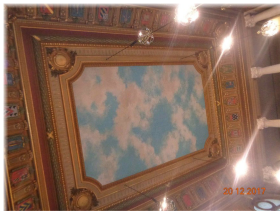
Plafond de la salle des séances avec les armoiries des différents canton de la Côte d'Or