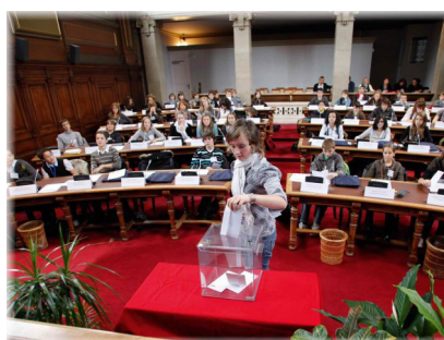
L'élection du bureau du CDJ... Voir article page précédente.