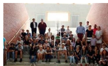
Cliquez sur la photo...

Chers camarades du collège Edouard Herriot, Je suis particulièrement contente de vous représenter au Conseil Départemental des Jeunes pour les deux années à venir. Je souhaite m'impliquer dans ce nouveau projet visionnaire : Comment voyez-vous le département 21 dans 30 ans ? Je suis ouverte à vos propositions, écrivez-moi via Liberscol.