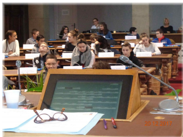
Questions- Réponses entre les Conseillers Départementaux jeunes et les élus adultes Conseillers