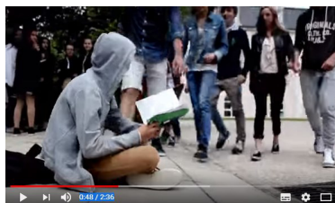
"Lutte contre le harcèlement en milieu scolaire".