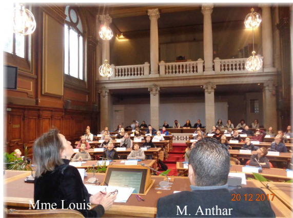
Découverte du rôle du Conseil Départemental et histoire de la salle des séances où nous siégeons.