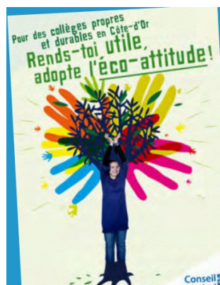
Création d'une charte : "Pour des collèges propres et durables en Côte d'Or".