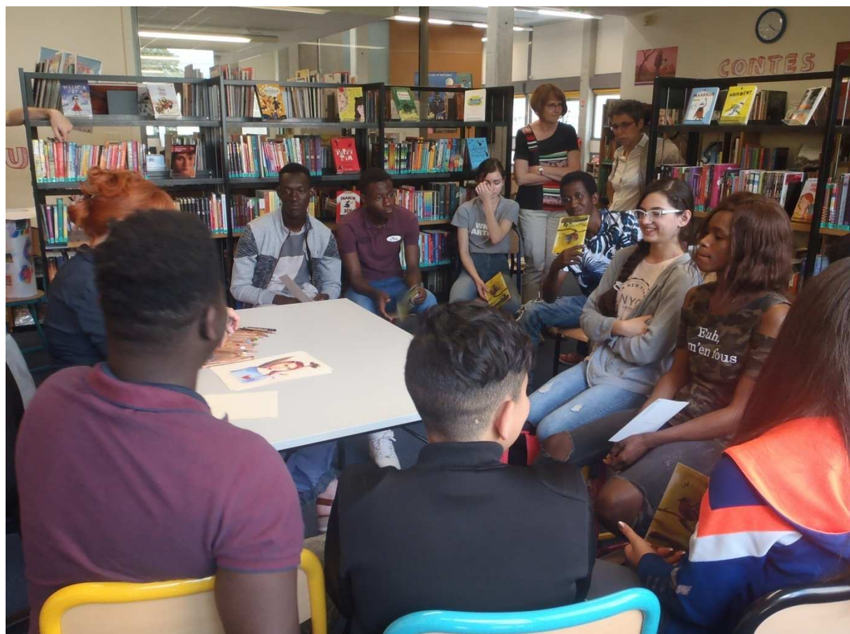
Notre classe à la médiathèque de Chenôve