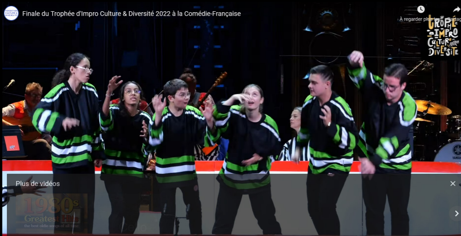
Equipe de Chenôve, championne du tournoi Régional Grand Est