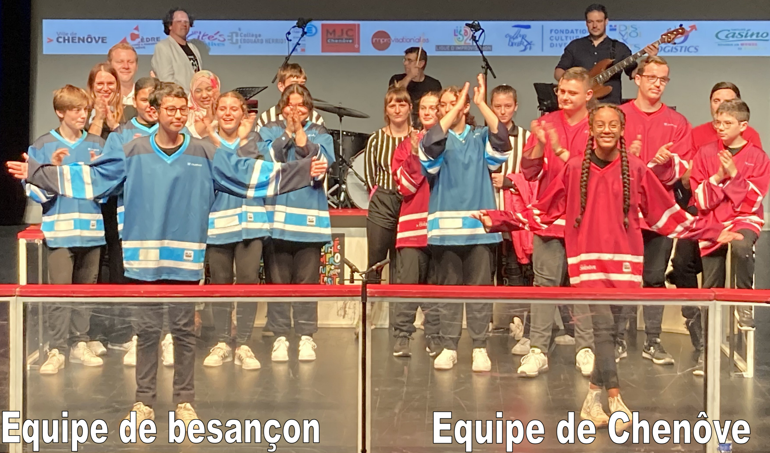
Equipe de besançon