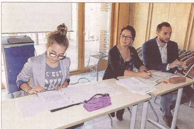
■ La Cour.

27 Comme le nombre d'élèves qui ont participé à la reconstitution d'un procès en correctionnelle au collège Édouard-Herriot à Chenôve.