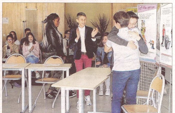
■ Ils se félicitent du verdict en leur faveur.

« Cette simulation m'a ouvert l'esprit et le monde de la justice est intéressant. Donc, pourquoi ne pas y réfléchir plus sérieusement. Mais j'ai 14 ans et pour l'instant, je veux faire éducatrice spécialisée pour enfants handicapés. »